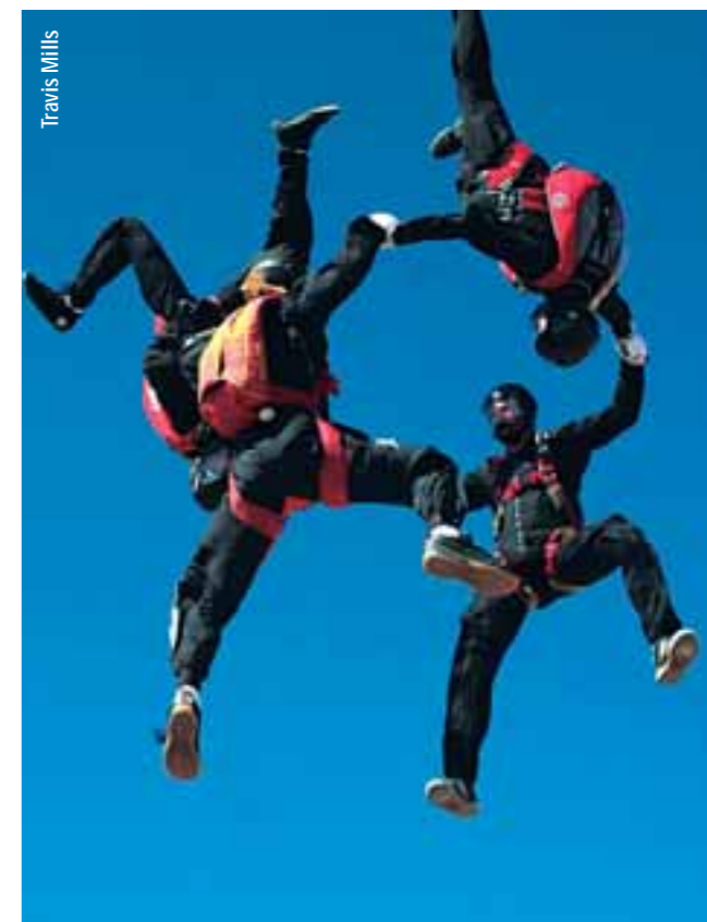
Dans le ciel d'Eloy, l'équipe Arizona Arsenal restitue les bienfaits de la soufflerie. Elle présente ici la figure libre Mixed Star.

qu'il puisse être un outil et une base de travail afin que la dernière rencontre en VFS, qui eut lieu au cours des Nationaux US en octobre 2006, puisse servir de test pour tenter de hisser la discipline au niveau international. Ainsi, à Eloy, cette compétition nationale de Vertical Formation Skydiving fut considérée par des juges officiels de l'USPA (fédération américaine) avec la même approche que pour une compétition de vol relatif à 4. Ces juges furent des spécialistes en vol relatif, et non en disciplines artistiques. Ceci s'avérait certainement plus judicieux car les épreuves de VFS présentent les mêmes particularités qu'en vol relatif. Il suffit d'examiner le tableau ci-joint du programme VFS et de ses figures à réaliser pour comprendre que, comme en vol relatif, une figure complète est égale à un point et que les enchaînements ou inters s'imposent dans la continuité d'un saut. On remarque aussi que ce programme comporte des figures mixées avec des positions tête en haut et tête en bas. Mais chaque figure est simplement réalisée sur un axe de travail vertical et sans considération artistique pour l'élevation du score.